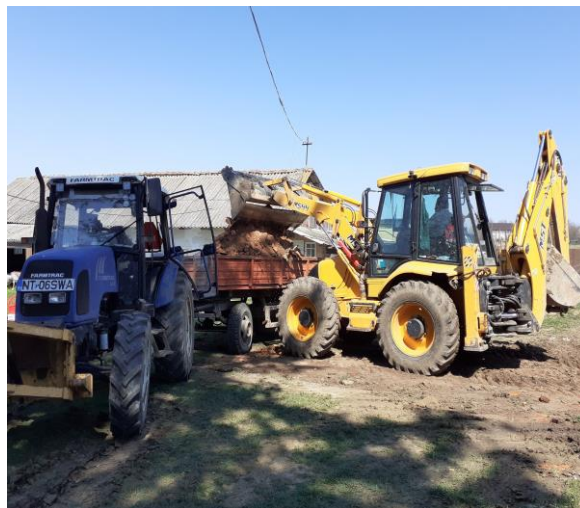
Utilaje in lucru

Au fost alocați bani pentru biserici si culte in valoare de 240.740 lei .