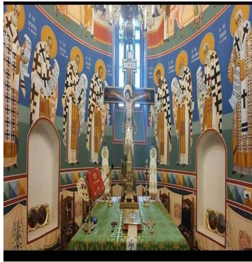
Biserica Valea Ursului - altar